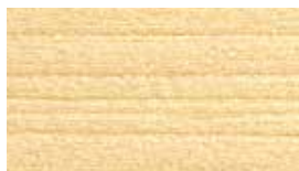
bezfarebná & báza P0000

Vzorkovník aktuálnych odličňov Primalex Lazúra hrubovrstvá: