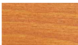
borovica & báza P0065